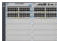
ProCurve Switch 5412zl Intelligent Edge (J8698A)