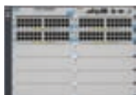
ProCurve Switch 5412zl-96G Intelligent Edge (J8700A)