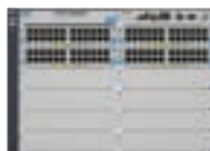
ProCurve Switch 5412zl Intelligent Edge (J8698A)